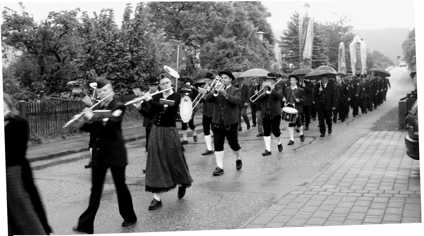
Kirchenzug, festlich umrahmt vom Musikverein Gars