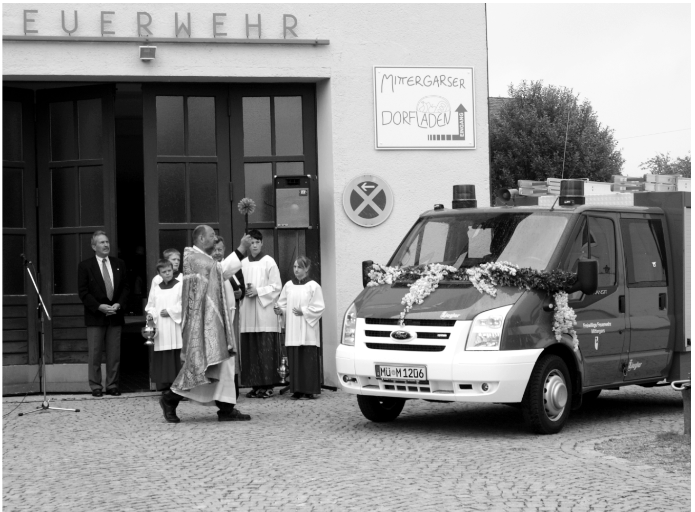
Pfarrer Bednara bei der Weihe des neuen Fahrzeuges